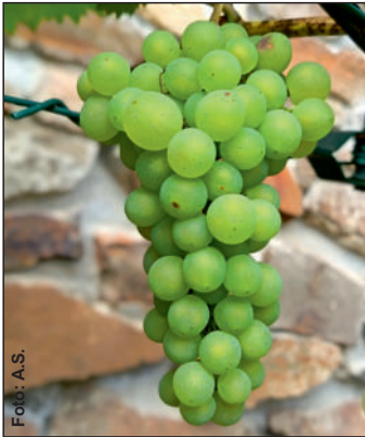
Rodauer Wein am Kirchberg.

Der Wein vom Südhang der St. Nikolaus Kirche