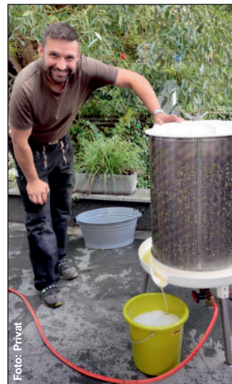
Auspressen der Maische.