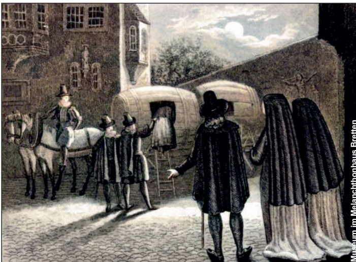
Museum im Melanchthonhaus Bretten