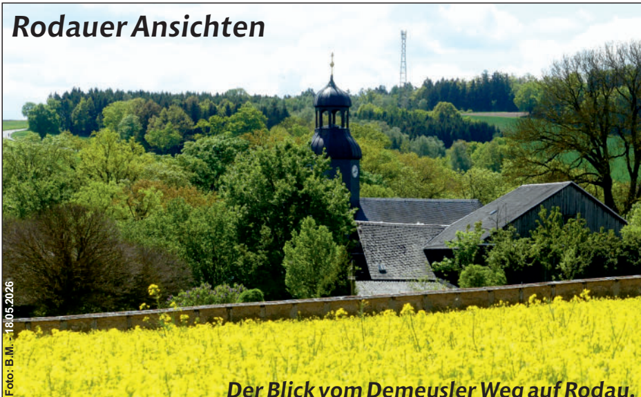
Der Blick vom Demeusler Weg auf Rodau.