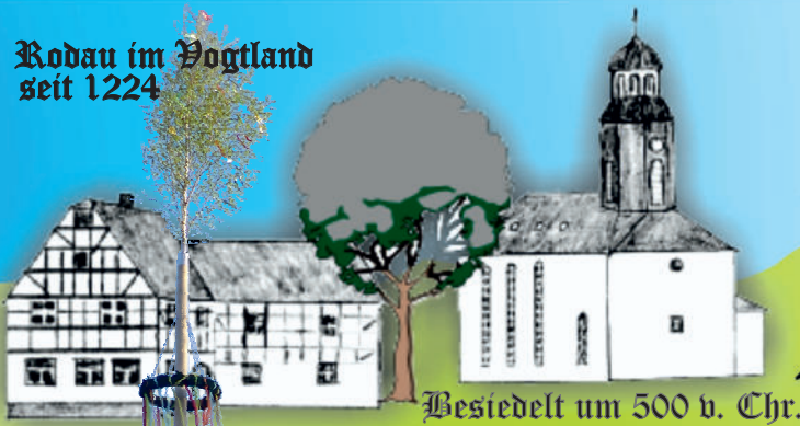
Besiedelt um 500 v. Chr.